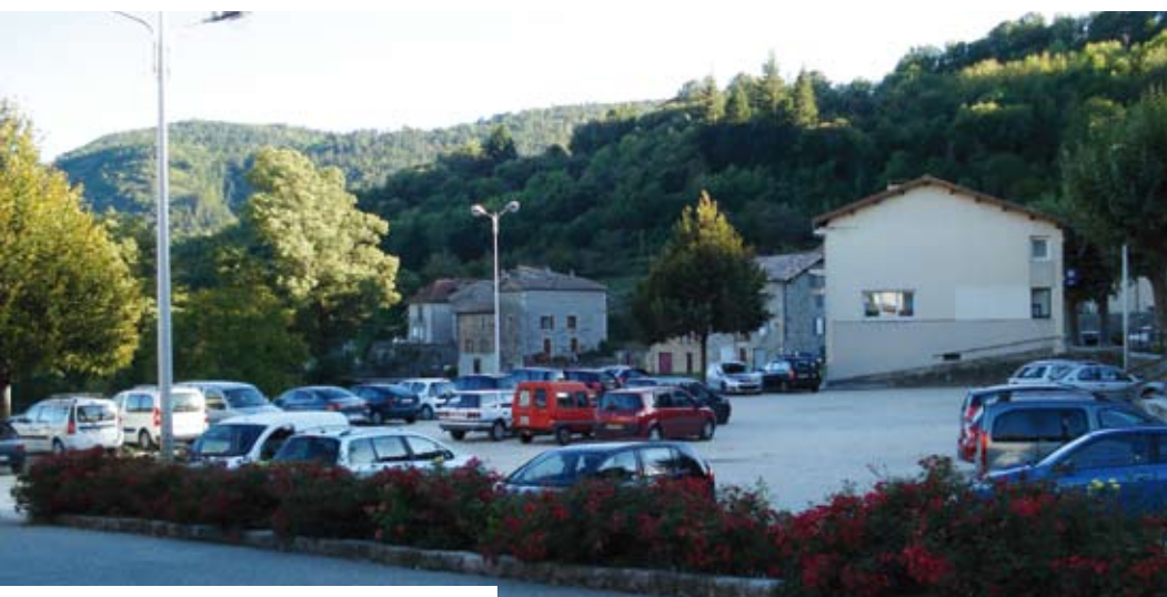
Ce que l'on ne devrait plus voir

Il est rappelé que les compteurs doivent être accessibles afin de faciliter leur relevé et, par ailleurs, il est demandé que chacun soit à même de faire une vérification régulière de son compteur pour détecter des fuites éventuelles.