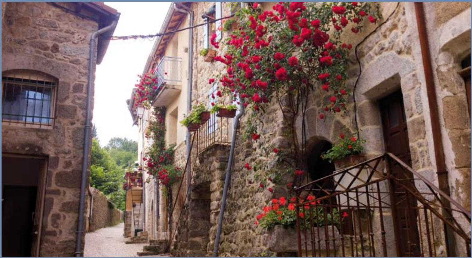
La rue Montlaur