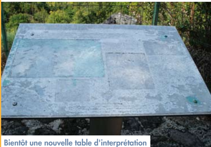
Bientôt une nouvelle table d'interprétation

Une nouvelle table d'interprétation est en cours de fabrication, elle sera posée sur le belvédère le plus bas (celui d'où l'on distingue la cascade) avec une signalétique appropriée, car de nombreux touristes se trouvaient pour le moins désemparés en arrivant sur site.